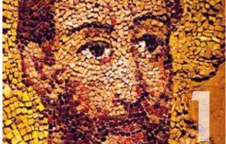
Paulus en Triest bondgenoten