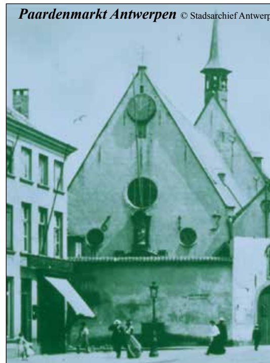
Paardenmarkt Antwerpen

Ik wens jou en je medezusters een zalig en voorspoedig aanstaande nieuw jaar en geef jullie als nieuwjaarsgeschenk de waardigheid en het geluk van een Zuster van Liefde. Want ik meen dat ik aan je roeping geen naam kan geven die verheven genoeg is. Wil ik je dienaar van God noemen? Dat is veel te klein en te weinig! Vriendin van God? Het is nog te weinig! Bruiden en beelden van God? Ik zeg nog niet genoeg! Engelen van de wereld? Nog niet genoeg! Maar ik mag zonder vermetelheid met de H. Schrift zeggen: 'Vos estis Dii'. Jullie zijn goden op aarde' [Joh. 10,34]. Inderdaad, je volgt Gods vermogen en voorzienigheid na want je voedt de armen van Jezus Christus. Je doet het manna dalen op de hongerige, je laaft de dorstige. Is dat niet de steenrotsen doen splijten en daaruit de levende wateren voor hen doen vloeien?