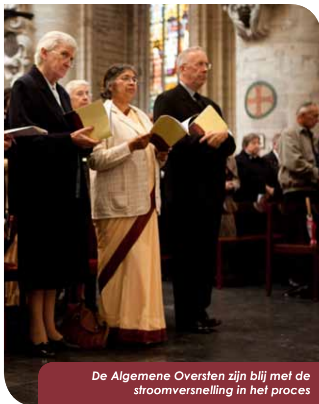
De Algemene Oversten zijn blij met de stroomversnelling in het proces