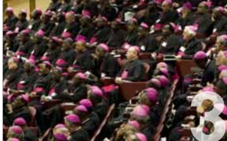
Was Triest aanwezig op de Synode?

v.u. Br. R. Stockman Stropstraat 119 . 9000 Gent